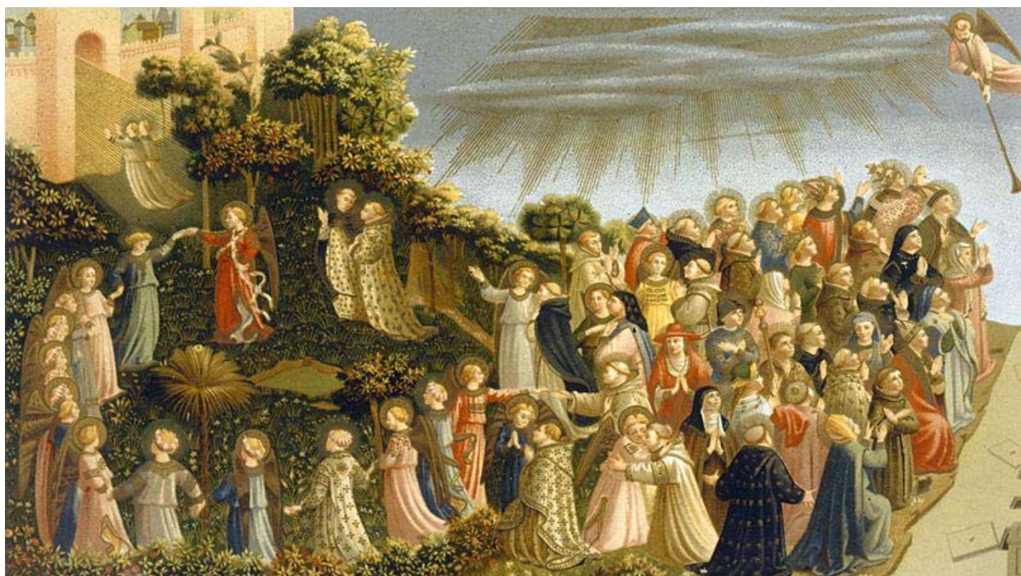
Le Jugement dernier * Fra Angelico * 1431 (détail)