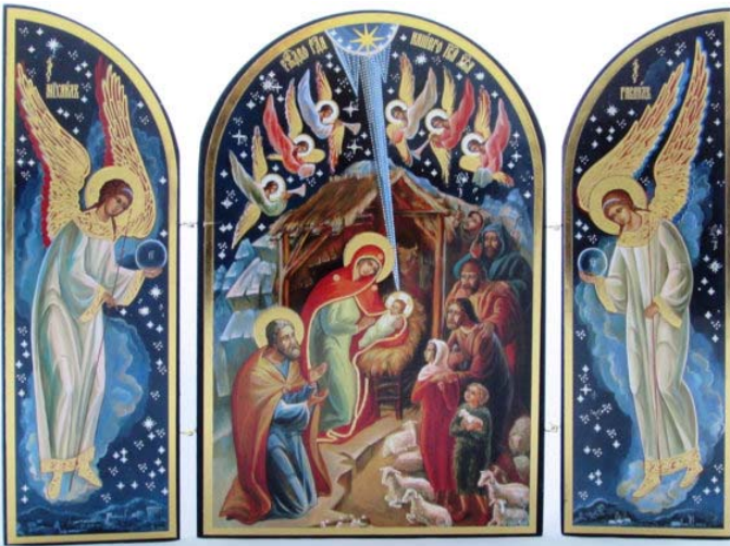
Triptyque de la Nativité russe